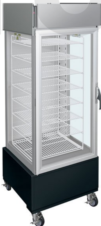
Тепловой шкаф Hatco PFST-1XB

Тепловые шкафы для пиццы Hatco серии Flav-R-Savor® позволяют поддерживать оптимальную температуру подачи пиццы. Горячий воздух мягко циркулирует по камере теплового шкафа, обеспечивая равномерный нагрев. Даже после открывания и закрывания двери температура камеры быстро восстанавливается, и продукт остается горячим.