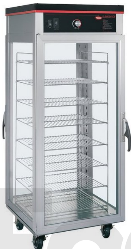
Тепловой шкаф Hatco PFST-2X